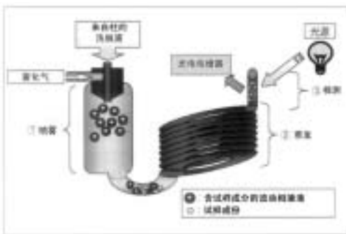
图 1 检测原理 (ELSD-LT)

没有 UV 吸收,也都能检测.....这句话,想起示差折光检测器(RID)。RID 是利用试样成分与流动相的折射率的差进行检测,而通常由于它们的折射率多少都有些差,基本上什么都能检测。然而,如果检测原理完全不同的 ELSD 与 RID 相比较,会是怎样呢?